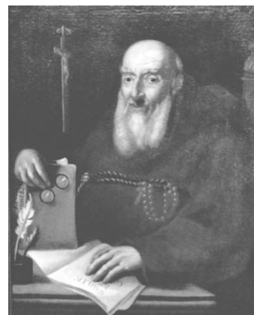
Padre Gaetano Migliorini da Bergamo, secolo XVIII

Infine un'opera di Giovan Battista Epis, Nostra Signora del Sacro Cuore , sec. XIX, che è stata esposta a Milano al Museo dei Beni Culturali Cappuccini in occasione della mostra Sacro e Liberty (31 ottobre 2008 - 28 febbraio 2009) - F. Rossini