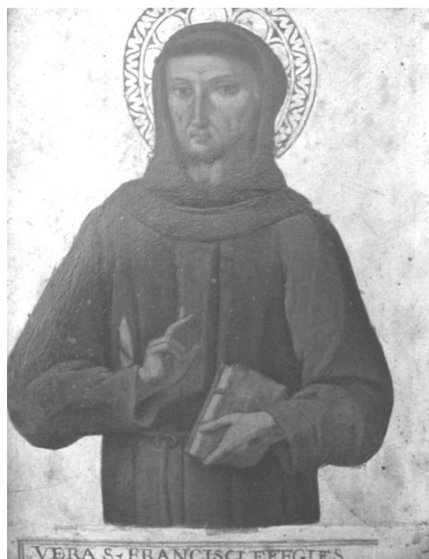
Francesco d’Assisi, secolo XVI